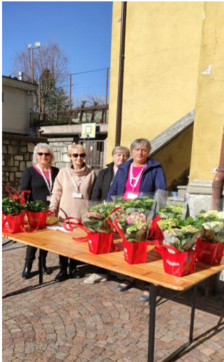
Gardena: banchetto a Chiuro in primavera per la vendita di fiori

Anteas ha iniziato una collaborazione con AISM (Associazione Italiana Sclerosi Multipla) aderendo alle campagne di sensibilizzazione atte ad aiutare la ricerca nel trovare una cura definitiva a questa malattia che coinvolge il sistema nervoso centrale. Malattia cronica, imprevedibile, spesso invalidante. La collaborazione della nostra associazione si concretizza con la disponibilità dei volontari Anteas a rendere note le iniziative, presenziare all'allestimento di banchetti con relativa vendita di prodotti il cui ricavato servirà per le dotazioni di macchinari sempre più sofisticati per una diagnosi tempestiva, per la ricerca riabilitativa e lo sviluppo di terapie innovative.