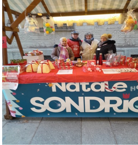
Banchetto di Natale